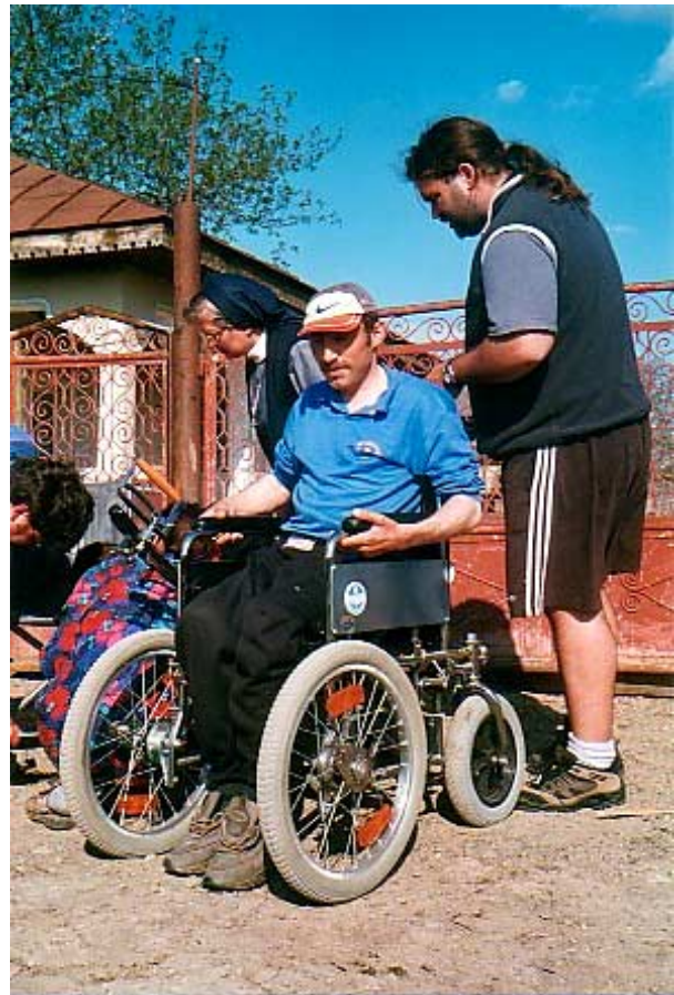
Endlich ein neuer, stabiler Rollstuhl

Am Stadtrand wohnt ein junger Mann, der bei der Holzarbeit von einem Baum getroffen wurde und seither querschnittsgelähmt ist. Die ihn pflegende Ehefrau bekommt monatlich 750 S Pflegegeld und je 75 S Kinderbeihilfe für die 2 unversorgten Kinder. Dank der jahrelangen Unterstützung der Firma SANAG , orthopädische Hilfsartikel , konnten wir seinen völlig defekten Rollstuhl gegen einen neuen Selbstfahrer austauschen.