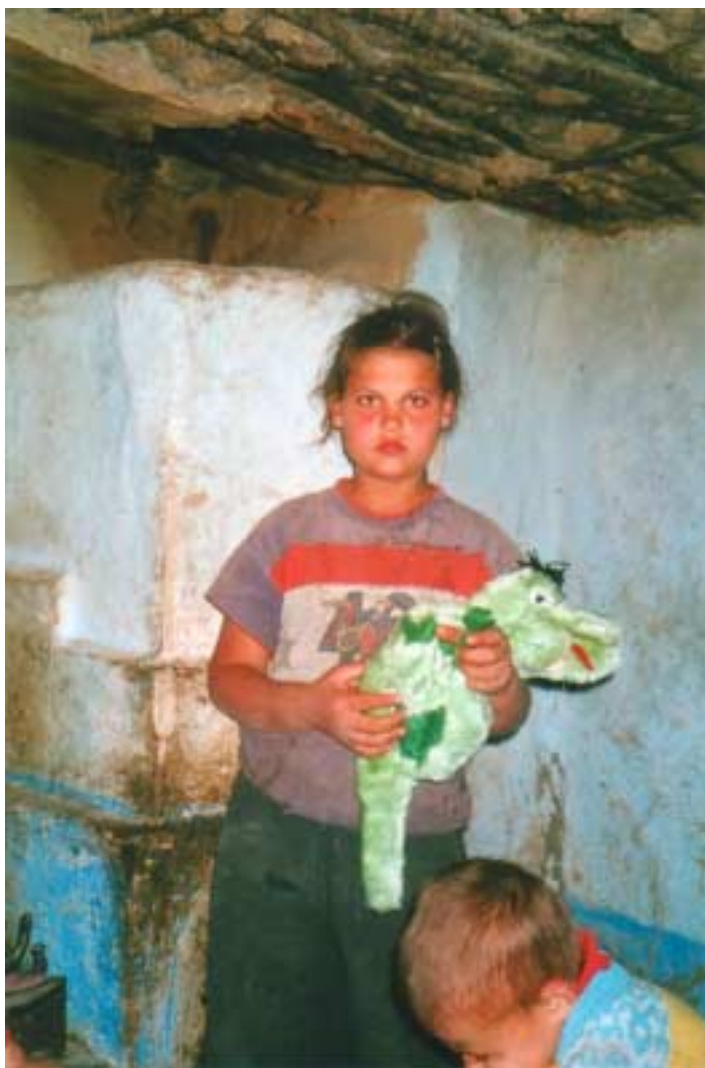
Gleich fällt die Decke auf den Kopf