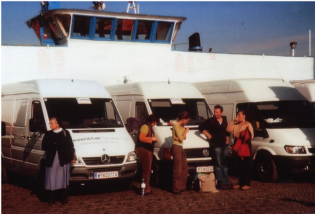
01_Am Weg zum Lepraspital - Fähre über die Donau

Bei der örtlichen Caritas hatten wir Kleider, Spielsachen, Einlagen, Windeln, Wolle, Decken, Verband, Schreib- und Kaffeemaschinen, Medikamente, Brillen, Schreibwaren und Deckenleuchten abgeladen.