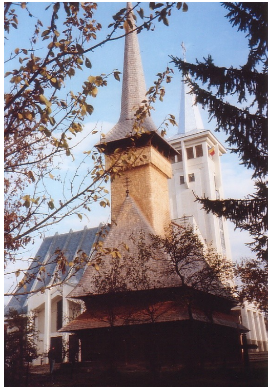
600 Jahre alte Holzkirche an der ukrainischen Grenze