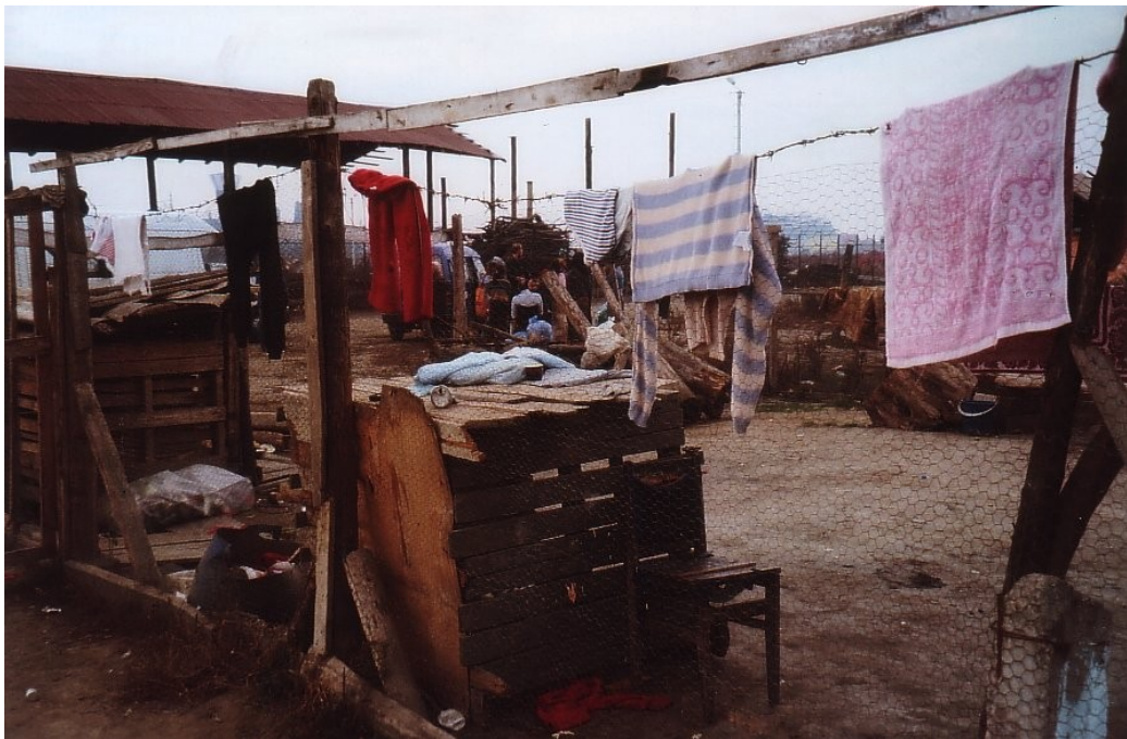
Wohnen im Romadorf

Die Papiere, die Bewilligungen für die Moldova waren wie immer schwierig, ein Laptop, ein Infusionsständer, gebrauchte