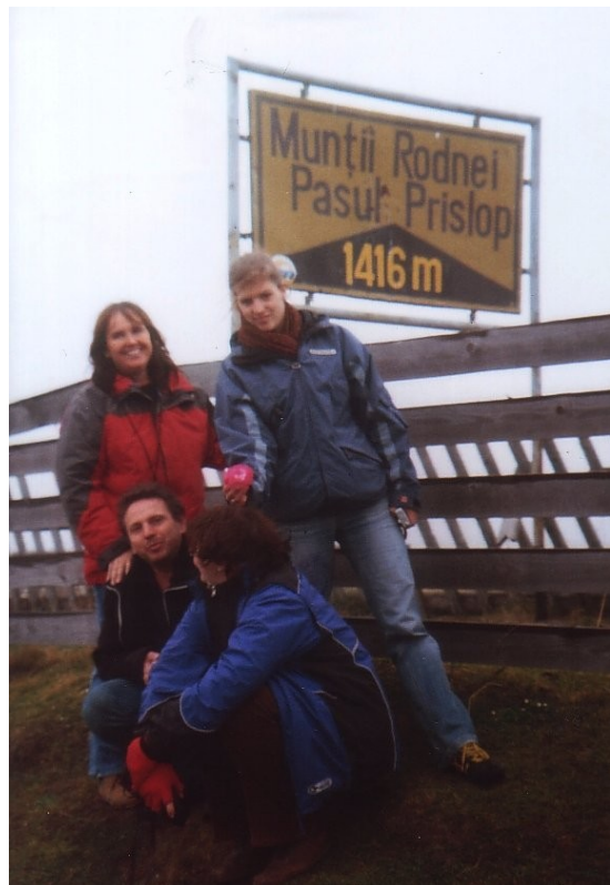
Zwei Tiroler und zwei Wienerinnen in den Karpaten