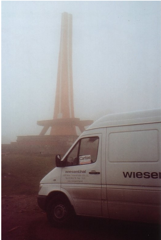
Nebel und Kälte am Prislop Pass