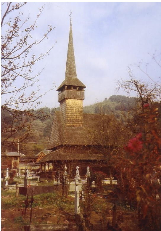
Holzkirche in Rozavlea im Maramures Gebirge