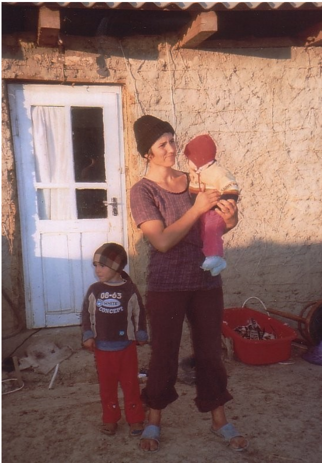
Lehmhütte ohne Strom in Horlesti

Über Klausenburg in Siebenbürgen ging es am nächsten Tag zu Herrn Spitzer von der Wr. Volkshilfe nach Luna und von dort zum Zigeunerdorf Lunci :