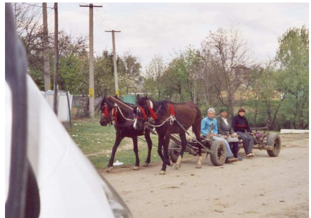
Gegensatz der Transportmittel

Wie immer besuchten wir mit der örtlichen Caritasschwester kranke und verarmte Familien zu Hause: