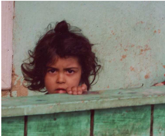
auch für mich gibt es jetzt Licht....

und nach 45 Minuten Aufenthalt waren wir wieder in Rumänien.