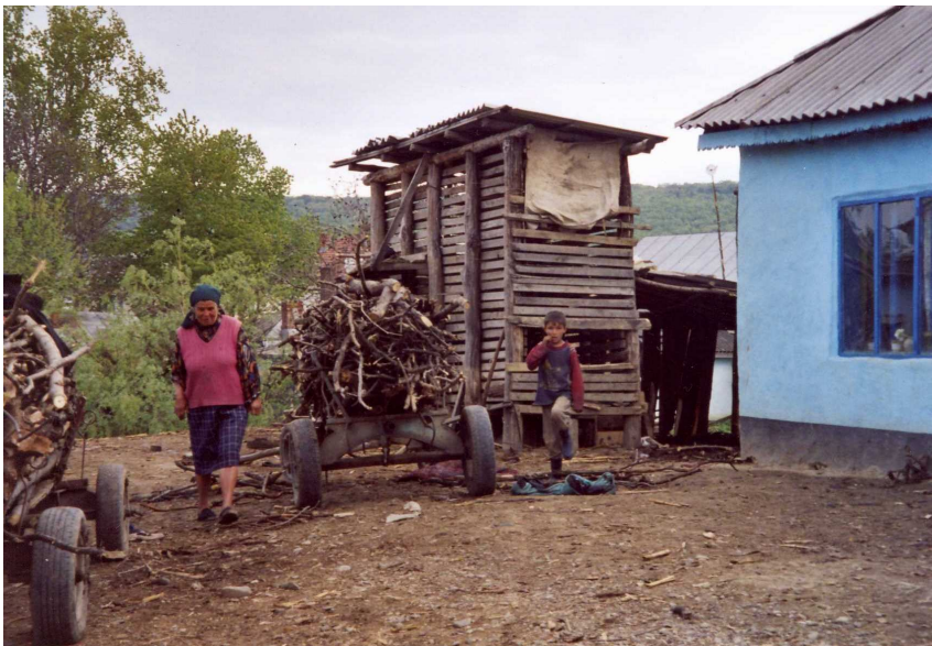
Rumänien in der EU!