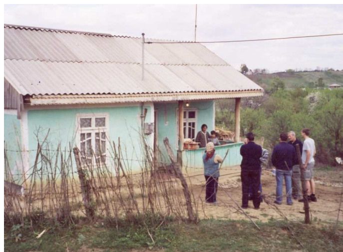
Danke für das Licht vor der Haustüre

Von den drei zentralen Dorfbrunnen müssen die Menschen in Kübeln das ver-