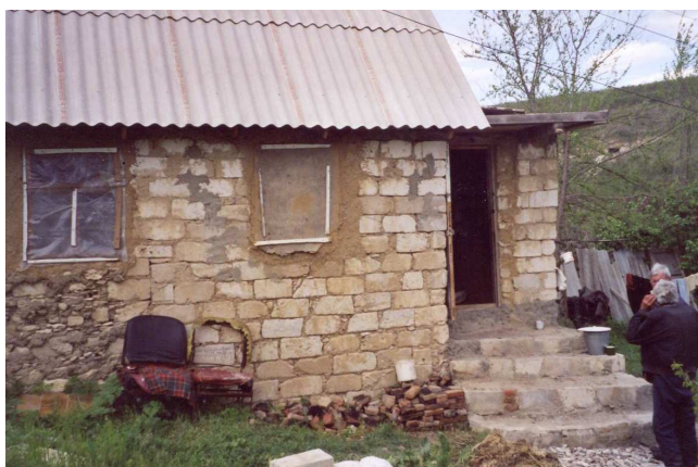
ohne Fenster, Steine vom Steinbruch geschleppt

Vor 10 Jahren waren die Vorbereitungen für Hilfstransporte in dieses Land noch viel leichter. Damals genügte eine Ladeliste auf deutsch, jetzt müssen Schenkungsurkunde, Hygienezeugnis, die genaue Auflistung der Waren, die Herkunft der Güter, die exakte Ladeliste, alles auf rumänisch, besser sogar auf russisch, sein. Es genügt nicht zu schreiben: "ein Karton mit Blei-, Bunt- und Filzstiften". Es muss alles genau abgezählt und angegeben sein, die Anzahl der Stifte, der Hefte, der Schreibblocks, der Mullbinden und sogar der Zahnpasten..... Und die Einfuhr jedes Kartons muss von der kommunistischen Regierung bewilligt werden, da-