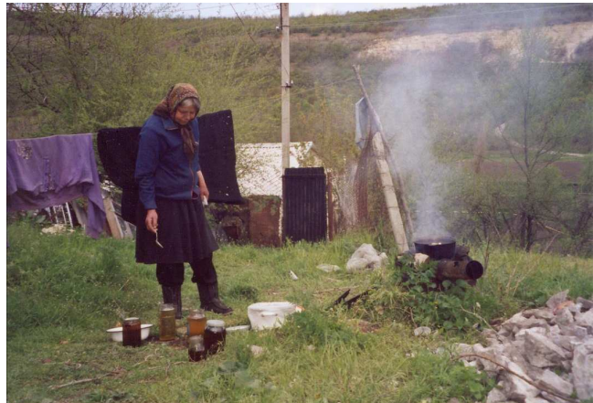
Küche im Freien, Moldova

ausgang über die 100 mitgebrachten Urinstomabeuteln.