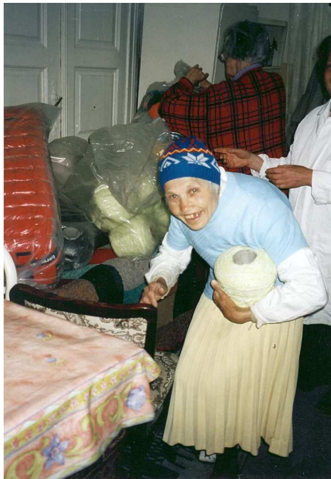
wieder Wolle im Altersheim

Gutai Berge mussten wir einen Reifenpatschen beheben, auf einem Wiesenstück neben der Strasse saß ein Schafhirte, der sich mit einer Plastikplane vor dem Regen schützte. Viel Schnee gab es noch am Weg zum 1416m hohen Prislop Pass. Vorbei an blühenden Kirschenbäumen, entlang von vielen unberührten Bächen und Flüssen, von saftigen Weiden und lieblichen Dörfern kamen wir abends „nach Hause“, zu unseren Steyler Missionsschwestern nach ROMAN .