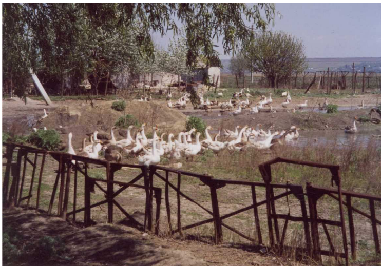
Landidylle in Moldova

Ein Anliegen von Sr. Patricia wäre es, einem 2-jährigen Mädchen, das an einer schweren Hormonstörung leidet, mit Medikamenten zu helfen. Bis zum Eintritt der Pubertät müsste sie monatlich eine Injek-