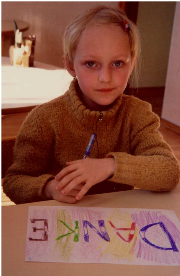
...für die 8 Kartons Hefte, Blocks und Stifte